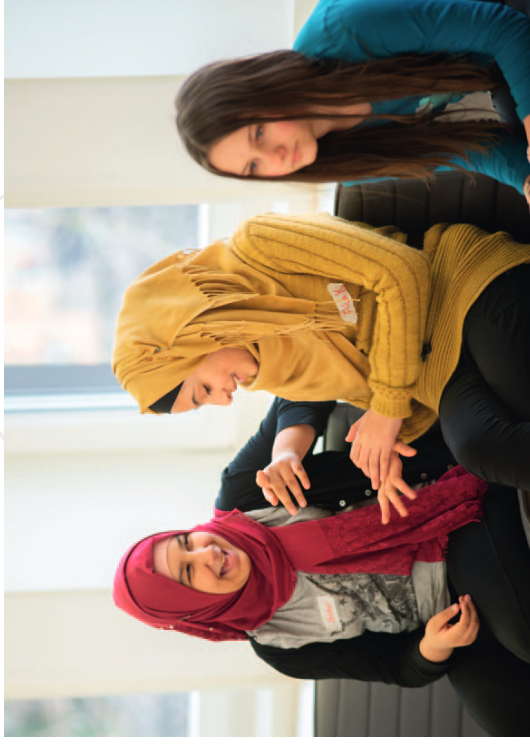
Seminar teilnehmerinnen diskutieren über Werte eines demokratischen Miteinanders.

Der Zwiespalt, einerseits mit zahlreichen Erwartungen an ihre „Integration“ konfrontiert zu sein, andererseits Ausgrenzung und zum Teil offene Diskriminierung zu erleben, resultiert bei manchen Befragten in skeptischen Perspektiven auf die Integrationswilligkeit der deutschen Gesellschaft. Als Beispiel werden Probleme genannt, die sich aus der Erwartung ergeben, dass die geflüchteten Menschen möglichst schnell Deutsch lernen sollen: „Aber ein Mensch, der geflüchtet und traumatisiert ist, der kann es nicht so einfach schaffen, die Sprache zu lernen. Deshalb wäre es gut, wenn es viele Infos gibt in den Sprachen, die die Flüchtlinge sprechen. Das gibt es aber nicht. Viele haben Angst, zu einem Amt zu gehen, weil sie die Sprache nicht sprechen. Sie verstehen das System in Deutschland nicht. Sie brauchen Informationen. Sich selbst seine Rechte zu holen ist schwierig.“