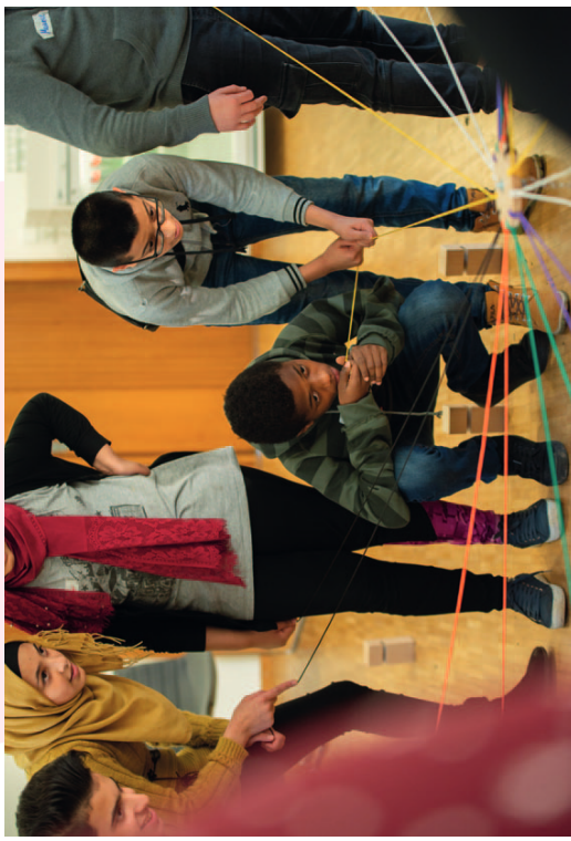
Kooperationsübungen befördern eine konstruktive Lernatmosphäre.

Zwei Jahre nachdem die Analyse „Außerschulische politische Bildung mit jungen Geflüchteten“ (zum Download auf der Website www.empowered-by-democracy.de ) die Erfahrungen der projektbeteiligten Träger im Themenfeld Flucht und Migration bündelte und Herausforderungen für die Weiterentwicklung benannte, werden im vorliegenden Text die Stimmen von jungen Teilnehmenden des Projekts „Empowered by Democracy“ im Mittelpunkt stehen. Im Sommer 2019 wurden 22 Jugendliche zu Gesprächen eingeladen. Themen der qualitativen – und natürlich für die Jugendlichen freiwilligen – Interviews waren ihre Lebenssituation ebenso wie das Erleben der Demokratie in Deutschland und ihre Lernerfahrungen und -erlebnisse im Rahmen von „Empowered by Democracy“. Von besonderem Interesse hinsichtlich letzterer waren die verwandten Methoden und didaktischen Formate sowie die spezifischen thematischen Interessen der jungen Menschen.